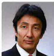
あさはら のぶはる 朝原 宣治氏